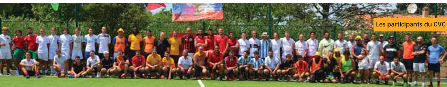
Les participants du CVC