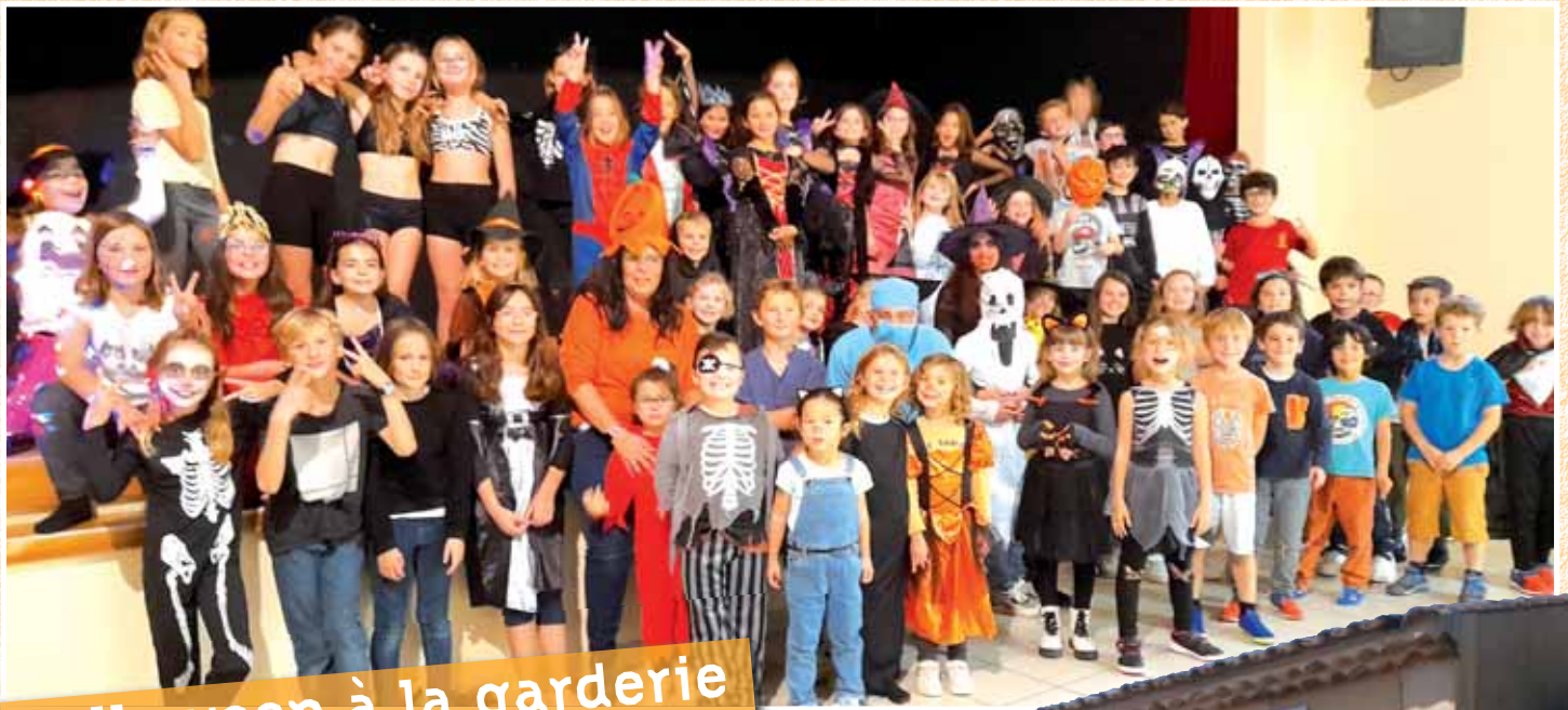
Halloween à la garderie