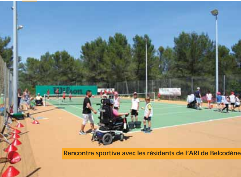
Rencontre sportive avec les résidents de l'ARI de Belcodène

L'année 2022 aura été une grande année pour le tennis Club de Belcodène. La remise à niveau de nos trois courts a permis d'offrir des équipements de qualité pour nos adhérents, mais aussi d'assurer l'ensemble des compétitions dans d'excellentes conditions.