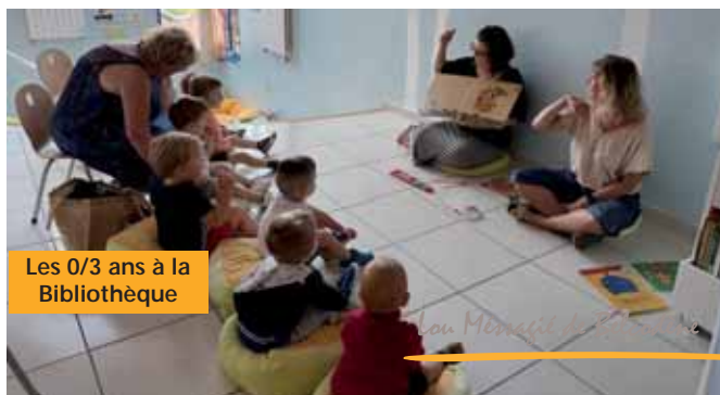
Les 0/3 ans à la Bibliothèque