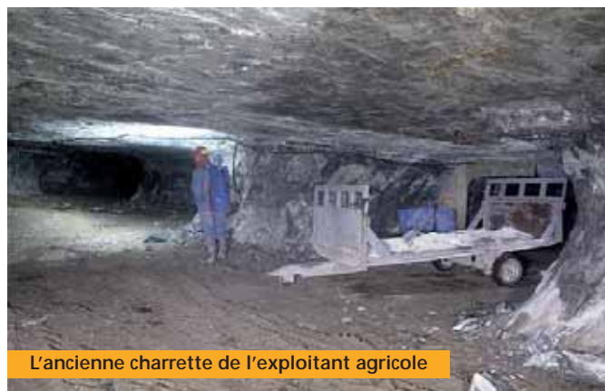
L'ancienne charrette de l'exploitant agricole