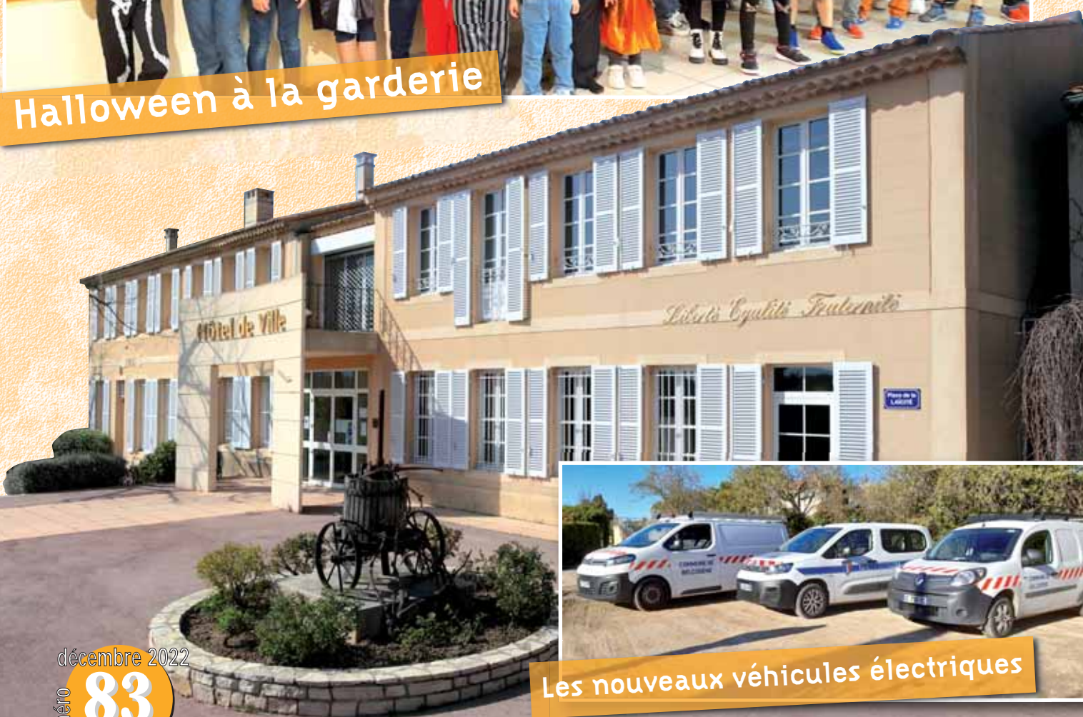
Les nouveaux véhicules électriques