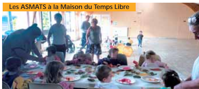
Les ASMATS à la Maison du Temps Libre