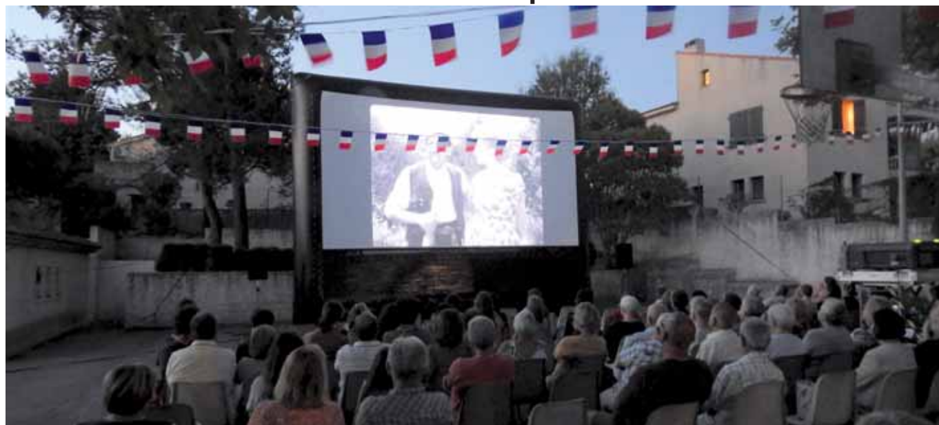
Par cette belle soirée d'été, nous étions nombreux à savourer un des chefs-d'œuvre de Pagnol "La fille du puisatier" projeté en plein air.