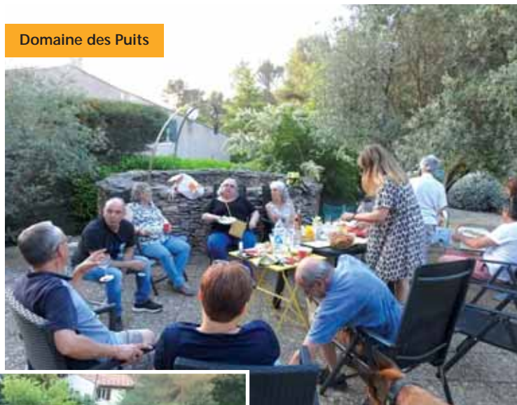
Domaine des Puits