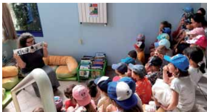
Accueil des classes. Restitution en classe entière du livre "Notre promenade dans le brouillard", réalisée en atelier par la classe des MS-GS d'après l'album "Promenade dans le brouillard de Milan" de Bruno Munari. (année scolaire 2021/2022)

Nous lisons (toujours !) et quand nous en avons le temps, nous prolongeons ces lectures par des ateliers d'écriture ou d'illustration. Ces ateliers offrent aux enfants un temps long pour observer, expérimenter, approfondir. Ce sont d'autres portes d'entrée vers l'art et la littérature.