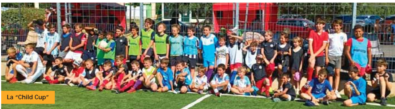
La "Child Cup"