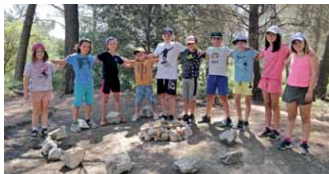
Nuit de camping à Manaque et Coudoulet