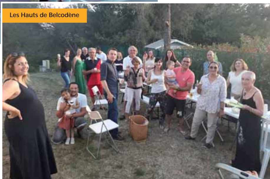
Les Hauts de Belcodène

C'était le vendredi 20 mai 2022, une date nationale, ou de nombreux Belcodénois se sont retrouvés sur le chemin de l'Adret, des Michels et du grand lot, dans les lotissements du Puits et les Hauts de Belcodène, au quartier des Hautes Bastides... autour d'un buffet participatif, en toute simplicité, pour partager ce moment de convivialité, d'échange et de bonne humeur. Pour certains l'opportunité de faire connaissance et pour d'autres l'occasion de retrouvailles.