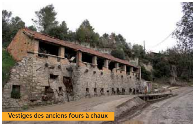
Vestiges des anciens fours à chaux

De réputation, il est toujours évoqué "champignonnière" au sujet de ces lieux. Ce sont d'intenses quartiers de champis qui furent, avant tout, des exploitations de pierre à ciment. Les excavations n'ont pas été réalisées dans le seul but de cultiver du champignon. Aujourd'hui, les vestiges de champis sont très présents, cela marque le paysage souterrain.