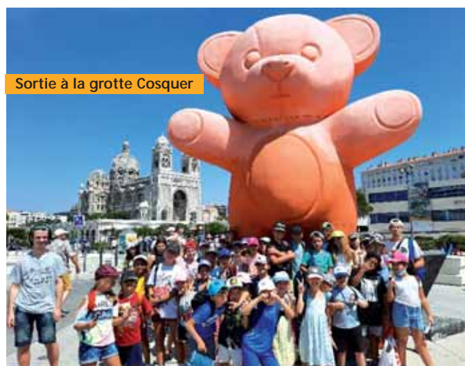
Sortie à la grotte Cosquer