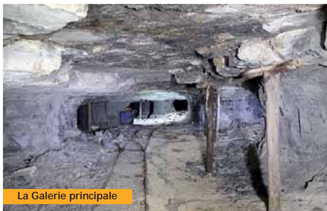
La Galerie principale