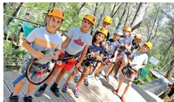
Sortie Accrobranche sur le site du Royaume des arbres à Auriol