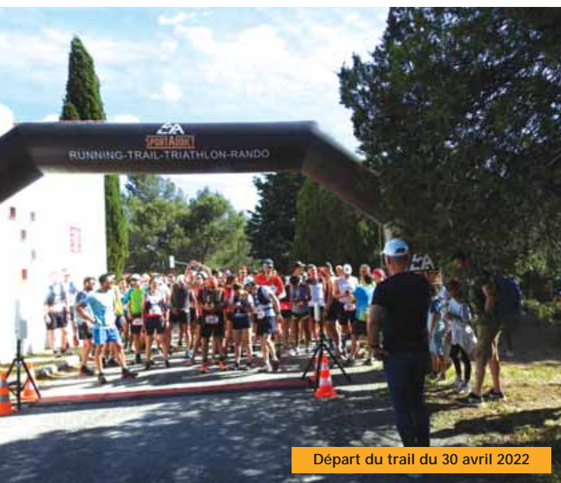
Départ du trail du 30 avril 2022

La répartition adultes-jeunes est en train de se ré-équilibrer, ce que nous notons avec plaisir car la politique du club a toujours été axée sur la jeunesse. Le retour en force des filles dans nos effectifs nous comble de joie car le tennis est un sport pour tous et accessible à tous.