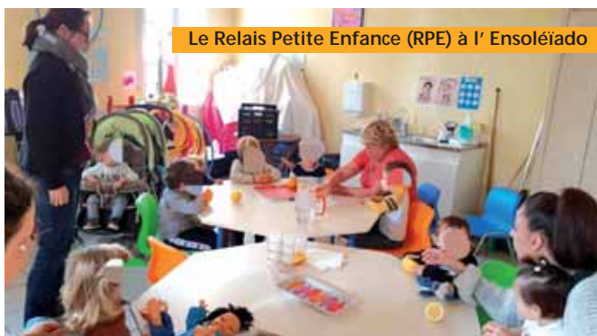
Le Relais Petite Enfance (RPE) à l'Ensoléiado