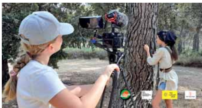
Tournage en extérieur

Sur les tournages, ils se sont responsabilisés en ayant des "places métiers", et ils ont pris beaucoup de plaisir à réaliser ces tâches.