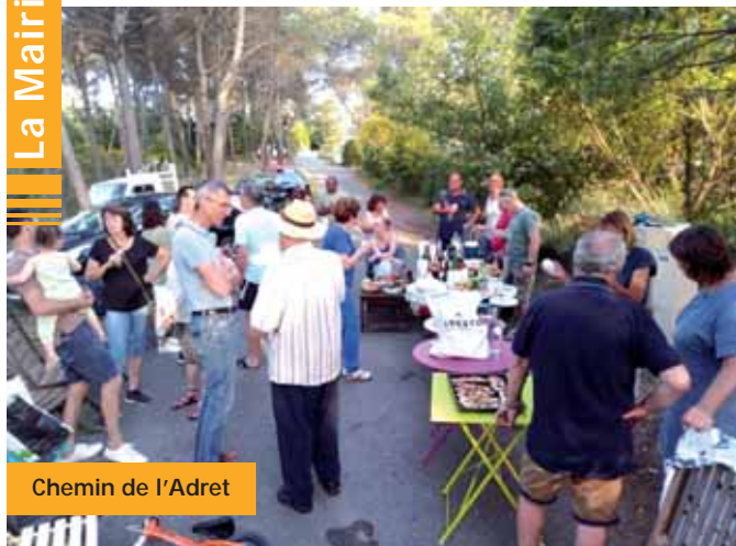
Chemin de l'Adret