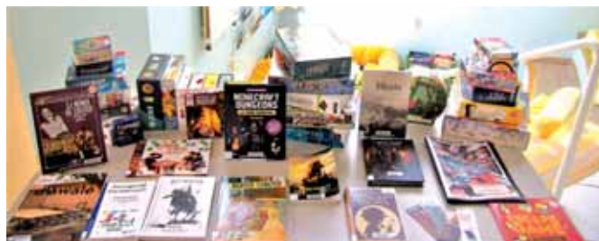
La ludothèque - Table d'expo

On joue beaucoup à la bibliothèque, et depuis de nombreuses années. Depuis la rentrée de septembre, c'est officiel : la ludothèque a un catalogue de jeux de plateau et de manuels de jeux de rôle - presque 40 jeux, à partir de 2 ans et sans limite d'âge, pour se retrouver en famille et entre amis. Ce fonds sera régulièrement enrichi, et vous pouvez venir jouer quand vous voulez, aux heures d'ouverture.