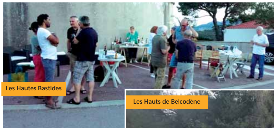
Les Hautes Bastides