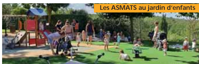
Les ASMATS au jardin d'enfants