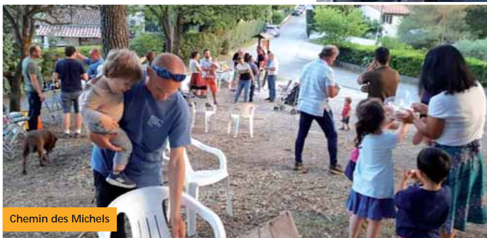
Chemin des Michels