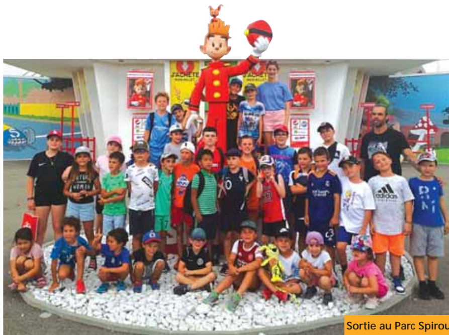
Sortie au Parc Spirou

Entente Belcodène - Gréasque pour les U6 à U11