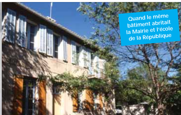
Quand le même bâtiment abritait la Mairie et l'école de la République