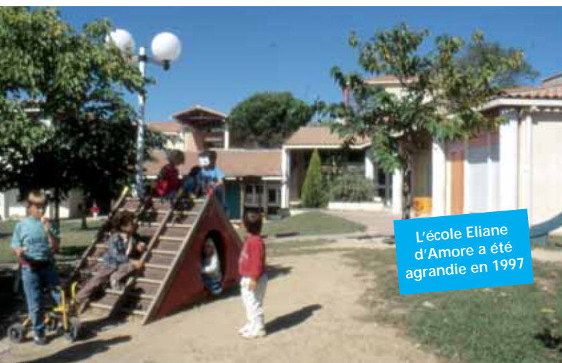
L'école Eliane d'Amore a été agrandie en 1997

Sur ces quelques dates nous souhaitons aux Belcodénoises et aux Belcodénois et à leurs enfants une très bonne fin d'année et de joyeuses fêtes.