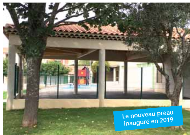
Le nouveau préau inauguré en 2019

Habitants : 1 937 en attendant le prochain recensement.