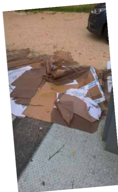
Photo générale de l'état des lieux

Tout comme nous avons "flouté" les noms du particulier et de l'association incriminés qui apparaissaient dans les photos.