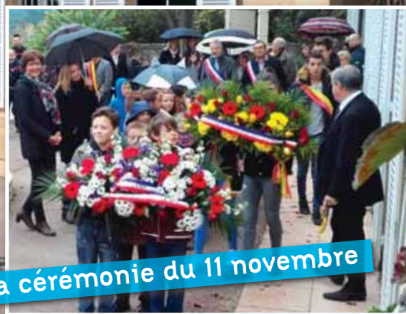
La cérémonie du 11 novembre