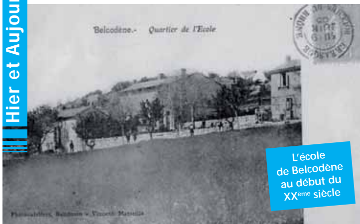
L'école de Belcodène au début du XX ème siècle