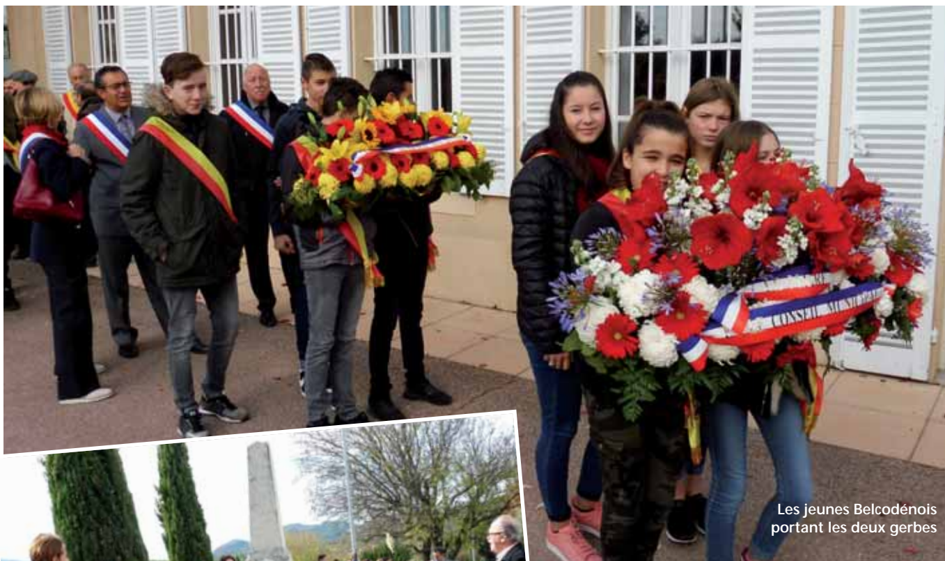
Les jeunes Belcodénois portant les deux gerbes