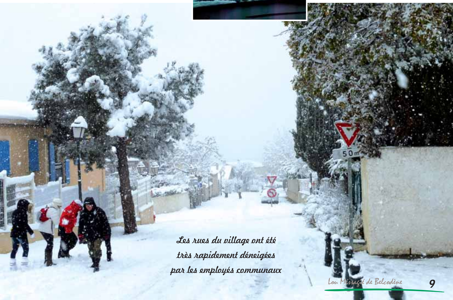
Les rues du village ont été très rapidement déneigées par les employés communaux

Bis répétita pour le premier jour du printemps avec de très beaux paysages "d'hiver à la montagne" pour ce 21 mars 2018 mais seulement le temps d'une matinée et puis le soleil a repris son droit dès le début d'après-midi nous rappelant soudain que nous étions bien au printemps.