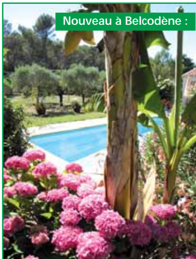
Lou Mésajil de Belcodène

Situé à 2 minutes de la forêt, "Lou Pichoun Nis" vous accueille : TV, Wifi, plateau de courtoisie. Terrasse avec table, chaises, transats, ping-pong. En saison, accès à la piscine, calme assuré