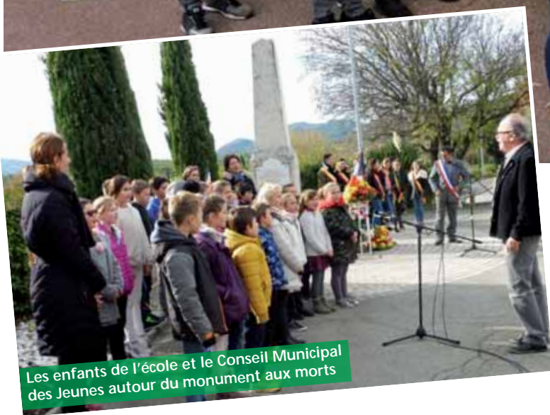
Les enfants de l'école et le Conseil Municipal des Jeunes autour du monument aux morts

C'est par une belle journée d'automne, que nous nous sommes retrouvés devant la Mairie ce samedi 11 Novembre 2017 vers 11 heures, pour célébrer la commémoration de l'armistice qui a marqué la fin de la "Grande Guerre".