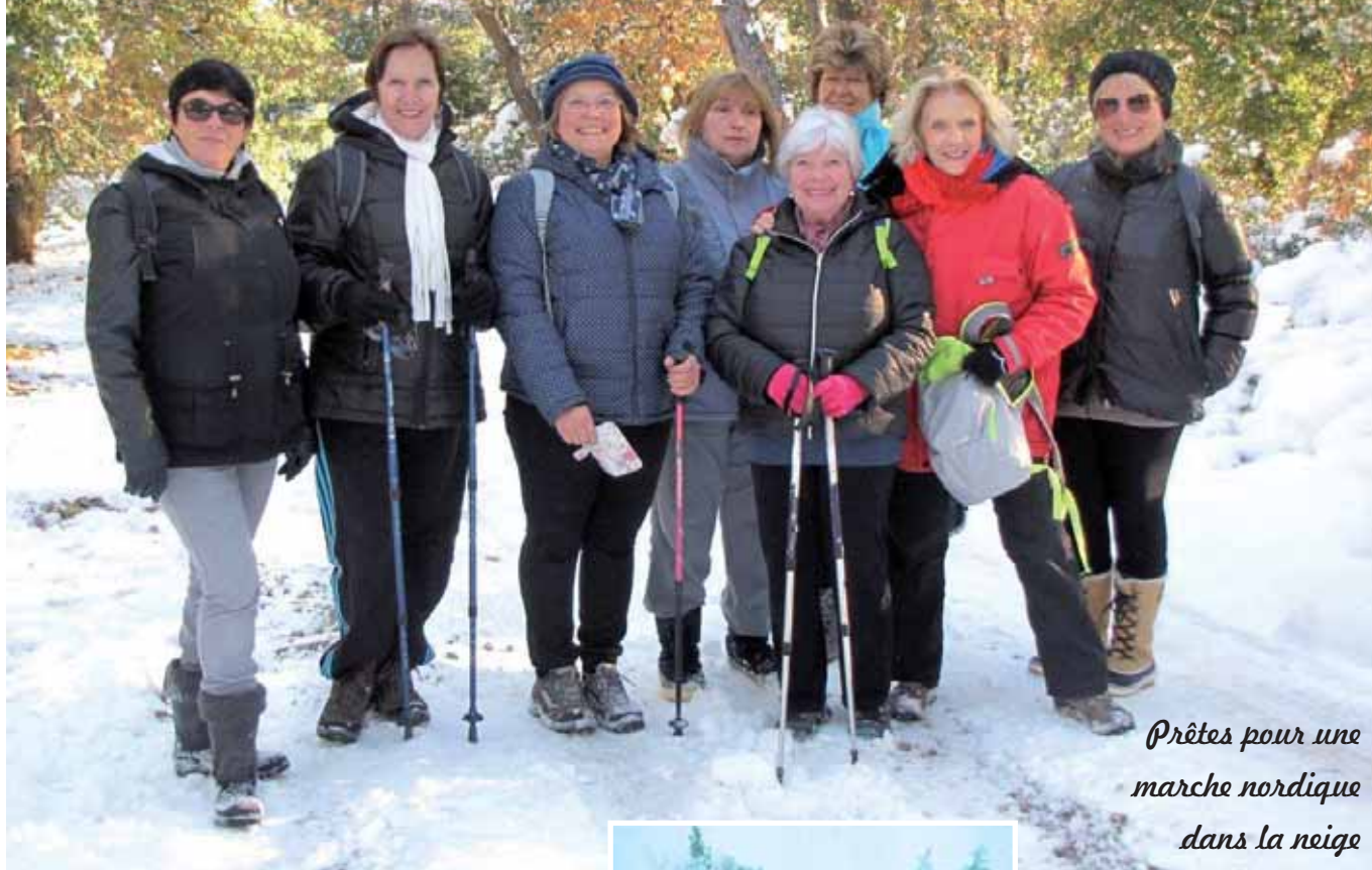
Prêtes pour une marche nordique dans la neige

Mais pensons aussi à ceux qui ont eu des difficultés pour se rendre au travail. Les routes sont restées dangereuses les jours suivants malgré les efforts des employés communaux qui ont assuré la sécurité sur les chemins communaux alors même que les routes départementales n'étaient pas toutes dégagées. Merci à eux pour leurs interventions ce dimanche même s'il n'a pas été possible de déneiger les accès privés. De belles images souvenirs tout de même.