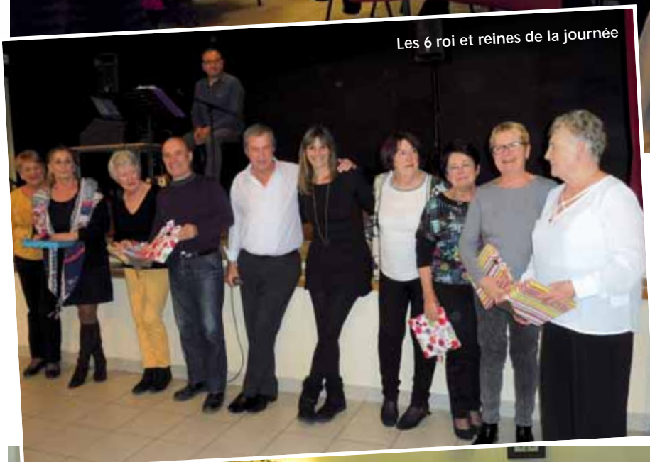
Les 6 roi et reines de la journée

Un après-midi récréatif autour de la galette des rois, réservé aux aînés belcodénois, a couronné 5 reines et un roi. Ils ont eu la chance de trouver le sujet caché dans les galettes ! Mais entre la dégustation et la coupe de champagne, les invités ont prouvé une fois de plus que la danse n'a pas d'âge, et la piste de danse n'est pas restée vide au rythme des tangos, rock, madison et autres. Nos anciens de la Commune répondent toujours présents à l'invitation de la Municipalité.