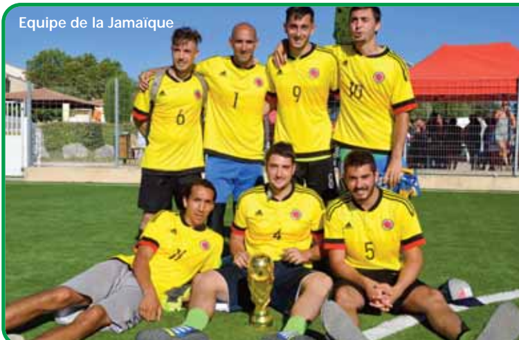
Equipe de la Jamaïque

Pour la première organisation de la Tsubasa Cup, une trentaine d'adultes se sont réunis le 11 juin 2017 pour participer à un tournoi 100% Belcodénois. Amateurs de foot et venus pour se détendre avec un ballon, les participants ont composé 6 équipes entièrement tirées au sort. Du jamais vu au foot ! Cela a su mettre une bonne ambiance entre toutes ces personnes de différentes générations qui se côtoyaient sans vraiment se connaître. Le tout sous une ambiance japonaise, car "Tsubasa" n'est autre que le héros d'un dessin animé japonais sur le thème du football.