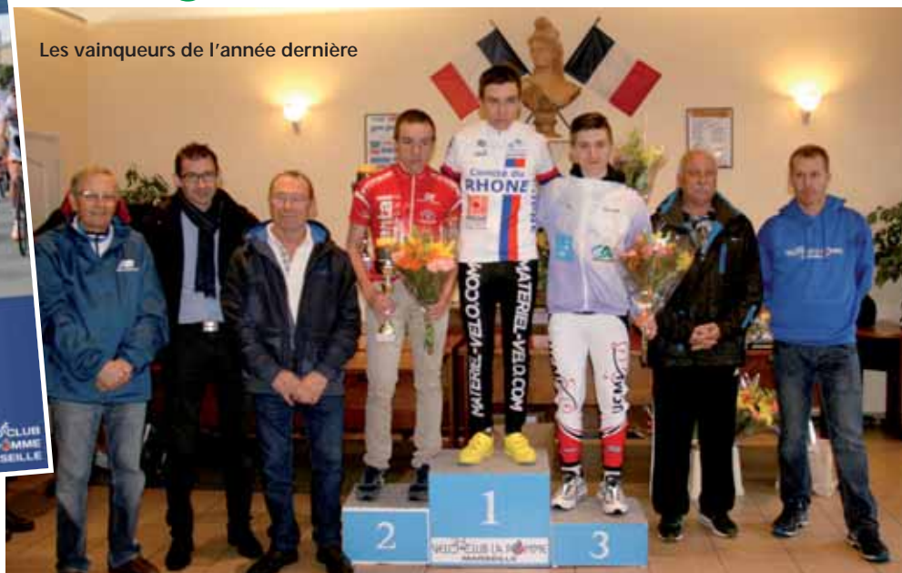
Les vainqueurs de l'année dernière

Organisé par le Vélo Club La Pomme de Marseille