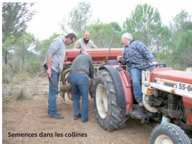
Semences dans les collines