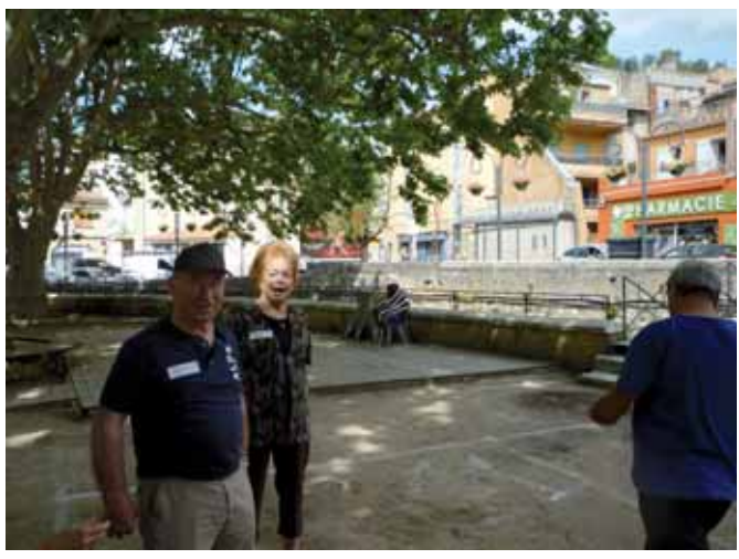
Il y a eu aussi le traditionnel concours de boules à Auriol , et malgré une journée ensoleillée, une bonne paëlla, nous passerons vite sur les résultats de nos participants.

Bientôt les vacances et comme toujours c'est à Manaque et Coudoulet que notre section arts décors s'est déplacée pour créer des papillons multicolores... avec des bouteilles en plastique.