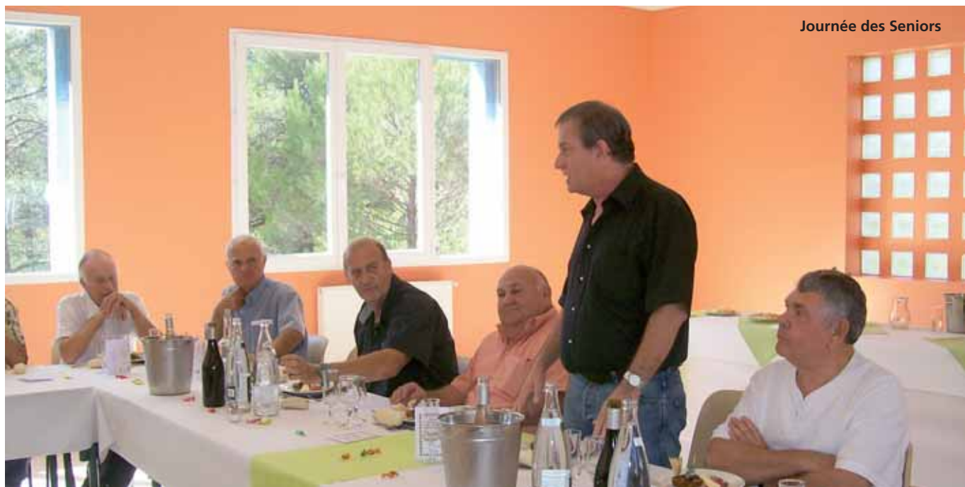
Journée des Seniors

Une journée de convivialité pour tous nos Seniors. La Commission pense la reconduire l'an prochain avec autant de brio, en espérant que le temps le permette comme cette année. Nous nous sommes retrouvés avant la matinée de chasse autour du traditionnel casse-croûte matinal. Après la partie de chasse, qui a confirmé que nos Anciens ont encore bon pied et bon œil pour ajuster leurs tirs et le partage du tableau réalisé par les vétérans, le verre de l'amitié et les traditionnels discours des autorités, le repas a été servi dans la salle des fêtes de Manaque et Coudoulet. Puis il y a eu la partie de boules.