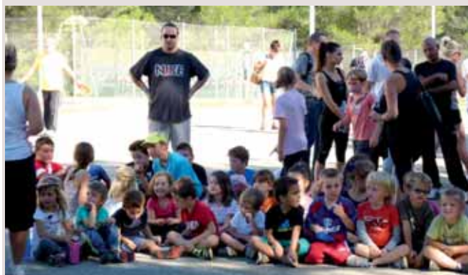
Les grandes sections attendent leur récompense

M. le Maire a gratifié chaque classe d'une coupe sportive ; et chaque enfant s'est vu récompensé par une médaille, offerte par l'APE (Association des Parents d'Elèves). L'APE a également organisé le goûter, qui accueillait les enfants à leur retour dans la cour de l'école. Une belle journée avec un esprit très fédérateur, juste avant les vacances de Toussaint !