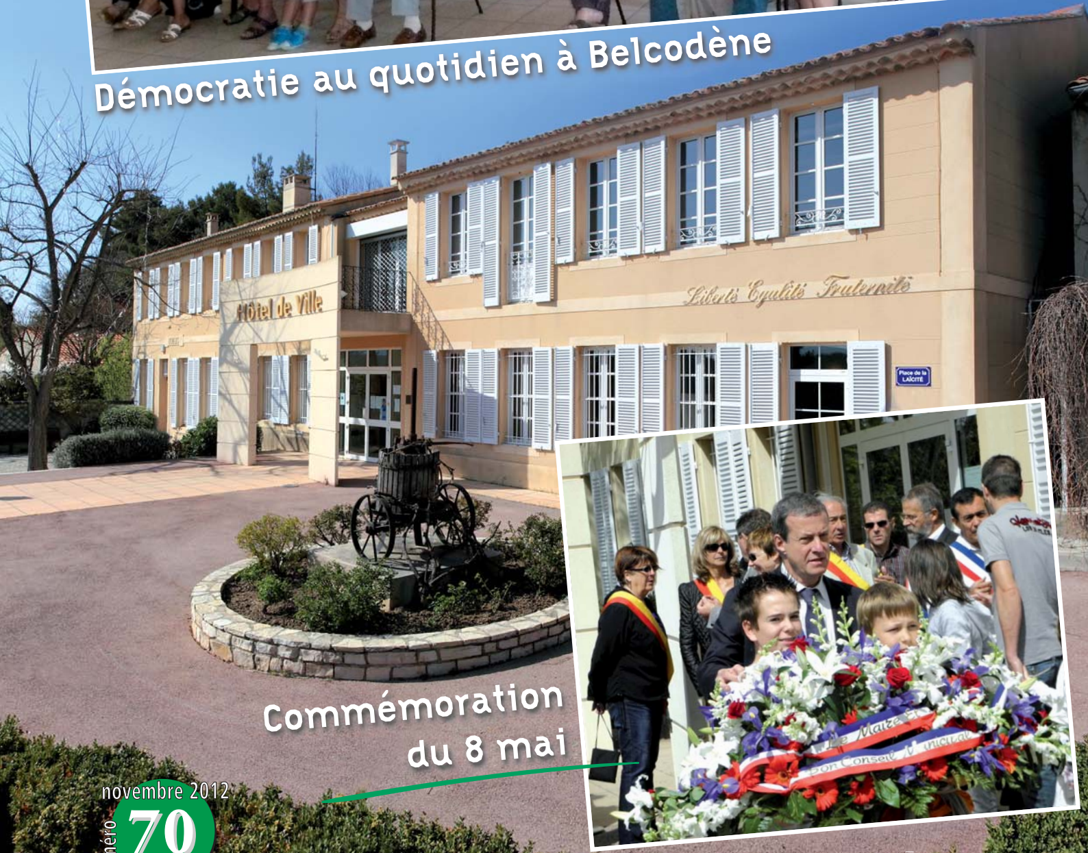
Commémoration du 8 mai