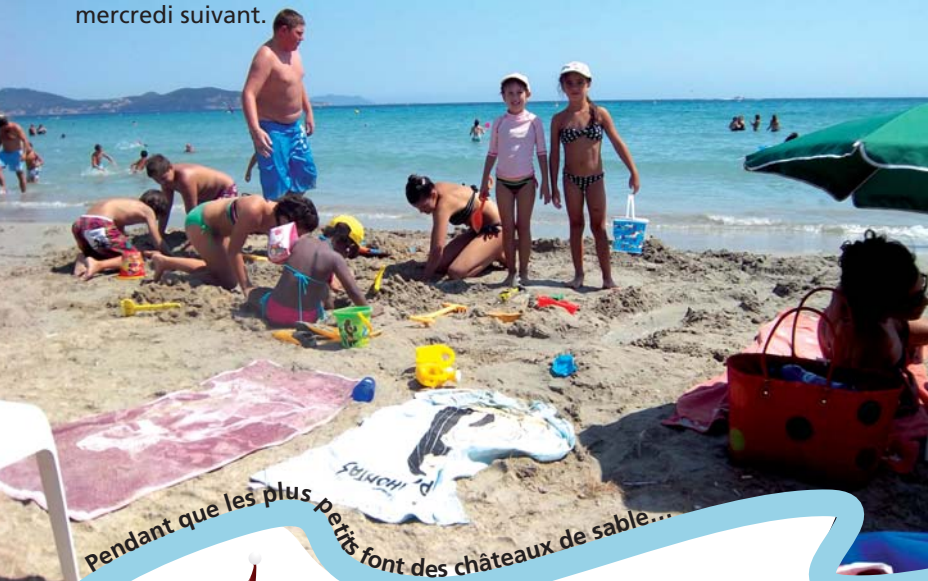
Pendant que les plus petits font des châteaux de sable...

Mise en place par la Municipalité, cette activité gratuite invite seniors, ados et petits enfants à profiter de la baignade. Et sur la plage, massages, gommages et châteaux de sable occupent tout ce monde. C'est à 17h que le car revient chercher les vacanciers de la journée, prêts à recommencer le mercredi suivant.