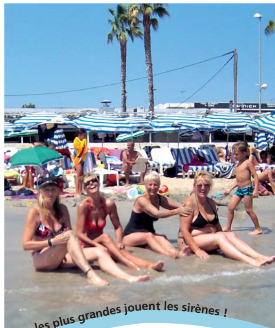
... les plus grandes jouent les sirènes !