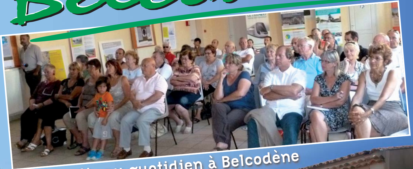
Démocratie au quotidien à Belcodène