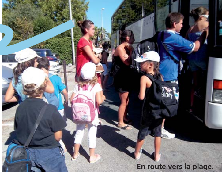
En route vers la plage.

En service depuis 1995, le car des plages obtient de plus en plus de succès. Tous les mercredis de juillet et août, le départ a lieu à 8h15 devant la Poste. Il permet aux Belcodénoises et aux Belcodénois de se rendre à La Ciotat pour une journée de détente.