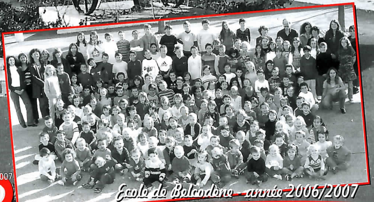
École de Belcodène - année 2006/2007