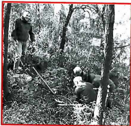
Entretien et remise en état des garennes élaborées par les anciens.

A cet effet, le Président a rappelé l'importance du retour de ces carnets en fin de saison, tant à la société qu'à la fédération, afin de réguler les espèces. Le non retour de ces carnets entraînera, la saison prochaine, des sanctions.