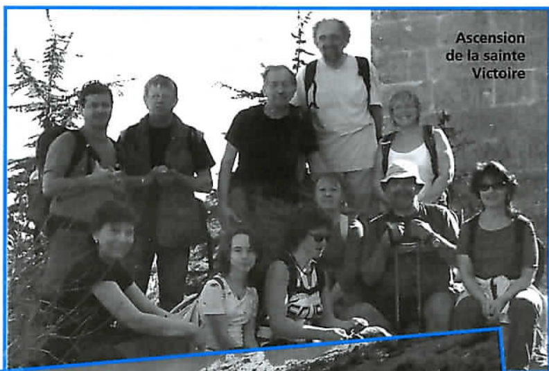
Ascension de la sainte Victoire