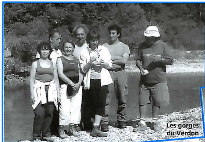
Les gorges du Verdon

Les randonneurs sur les traces de Cézanne