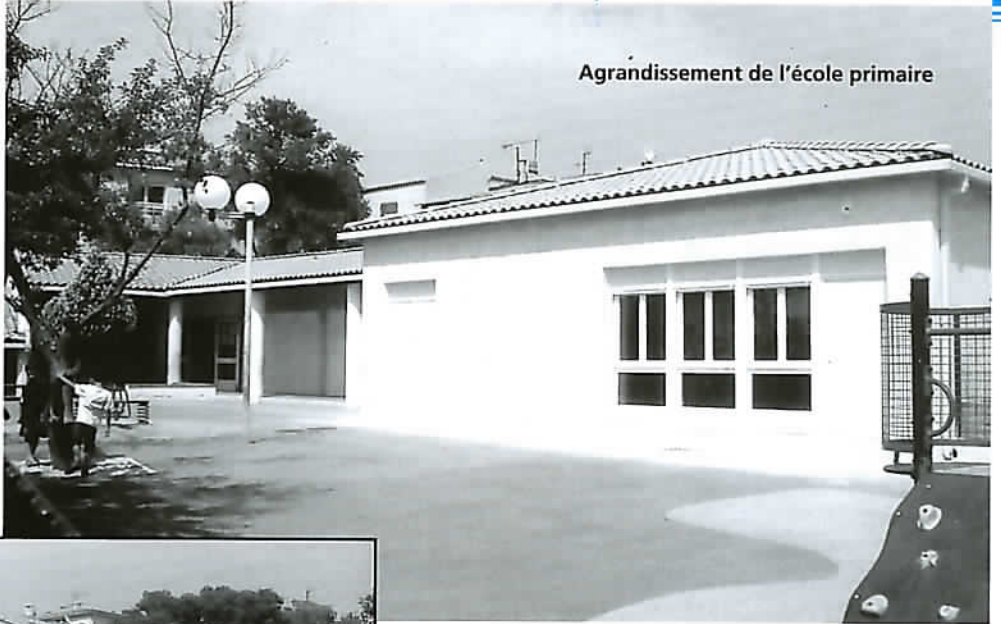
Agrandissement de l'école primaire

Cet ensemble sera opérationnel pour la rentrée 2006/2007. Une rentrée sereine pour nos enfants, en particulier pour la classe de CE2 de M. Thion qui, pendant deux années, a suivi ses cours dans le local de la place de l'Ensoléiado.