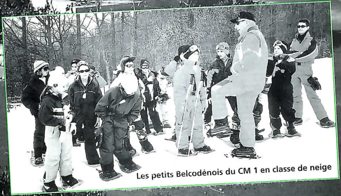
Les petits Belcodénois du CM 1 en classe de neige