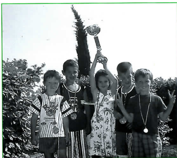
Les babies de l'ASCB, vainqueurs du tournoi régional de Rousset 99/2000.

Nous sommes très fiers du chemin accompli et, à l'aube du XXI ème siècle, nous sommes confiants dans l'avenir de l'ASCB section basket.