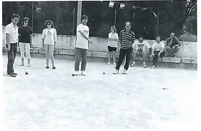
Tu la vises et tu la manques...