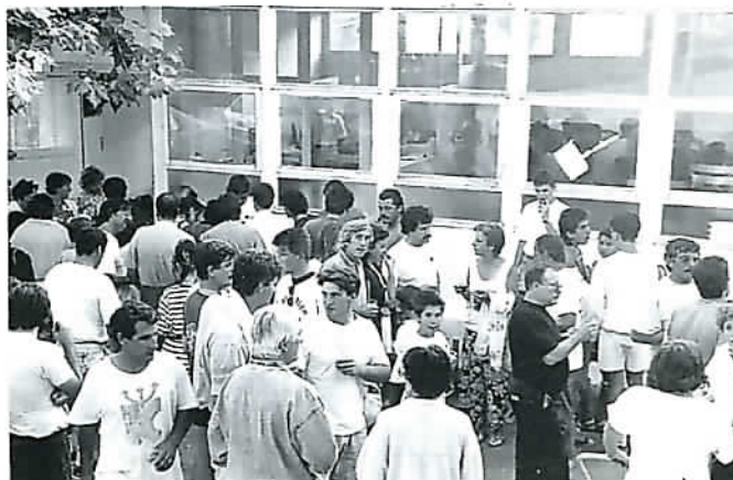
Une partie de l'assistance lors de l'Apéritif de clôture du tournoi de foot