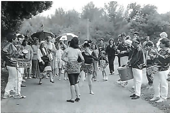
Délié de rues "Ria Manura"