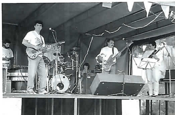
Ensemble musical Belcodène