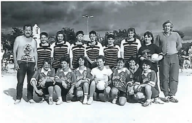
Les 2 équipes féminines, leur entraîneur et l'arbitre de la rencontre