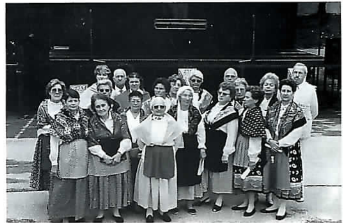
Ensemble vocal "La Soleiada" de Belcodène