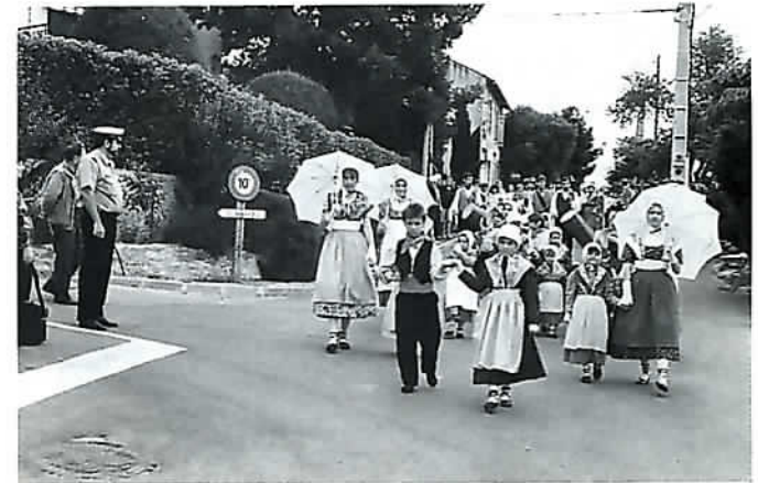
Groupe folklorique Lançon