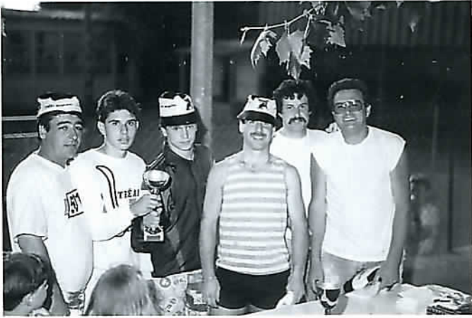
L'équipe gagnante "hommes" millésime 92