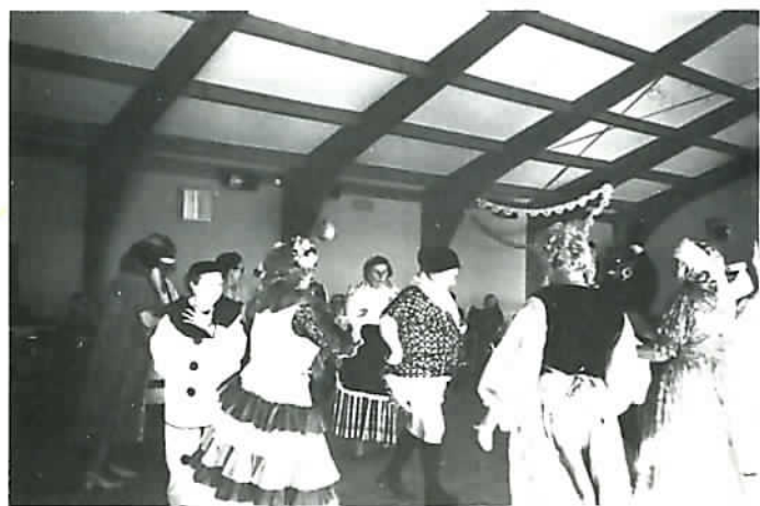
Le Carnaval des anciens